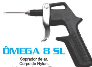
ÔMEGA 8 SL Soprador de ar. Corpo de Nylon. Acionamento por gatilho. Com bico prolongador ( 90 mm ).