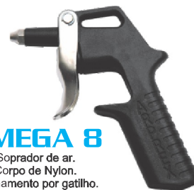
ÔMEGA 8 Soprador de ar. Corpo de Nylon. Acionamento por gatilho.